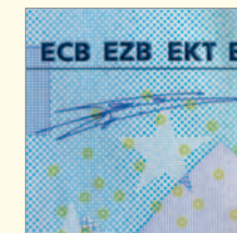
Willem F. Duisenberg